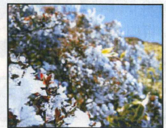
▲ちょうど樹氷が見えました